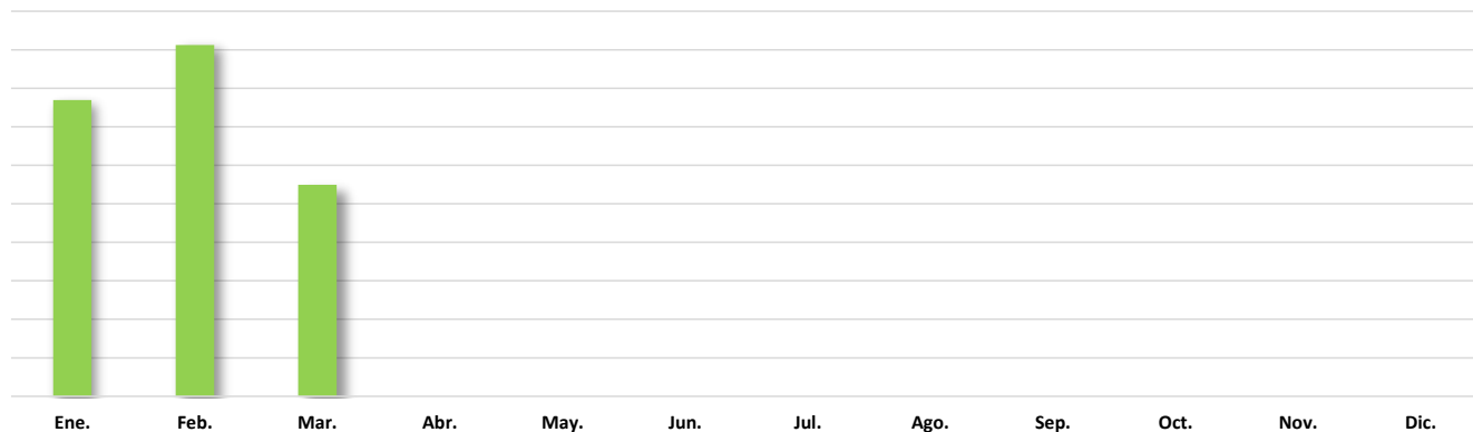
Gráfico No. 002 PORCENTAJE DE TRÁNSITO IRREGULAR DE EXTRANJEROS POR LA FRONTERA CON COLOMBIA SEGÚN REGIÓN DE PROCEDENCIA: AÑO 2020