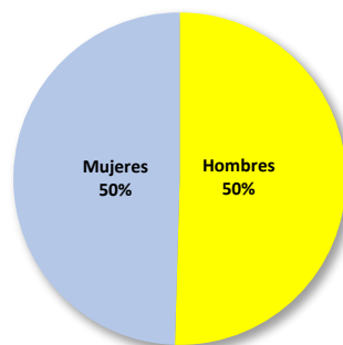
Gráfico. No 3 RELACIÓN PORCENTUAL DE LEGALIZADOS POR SEXO: AÑO 2019