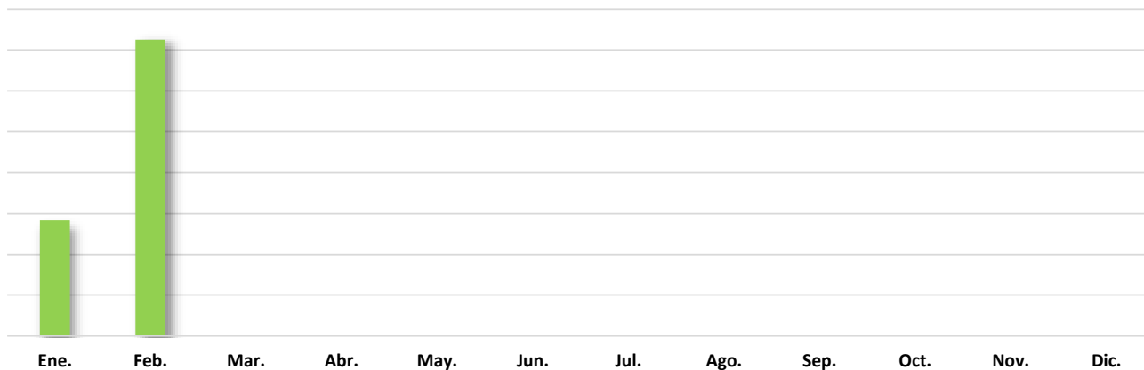
Gráfico No. 002 PORCENTAJE DE TRÁNSITO IRREGULAR DE EXTRANJEROS POR LA FRONTERA CON COLOMBIA SEGÚN REGIÓN DE PROCEDENCIA: AÑO 2019