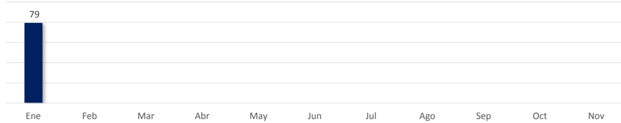
GRÁFICO DE REGULARIZACIONES EN PROCESOS EXTRAORDINARIOS (DECRETO 167 Y 168): AÑO 2020

Cifras preliminares al 31 de enero del 2020, sujetas a revisión y actualización.