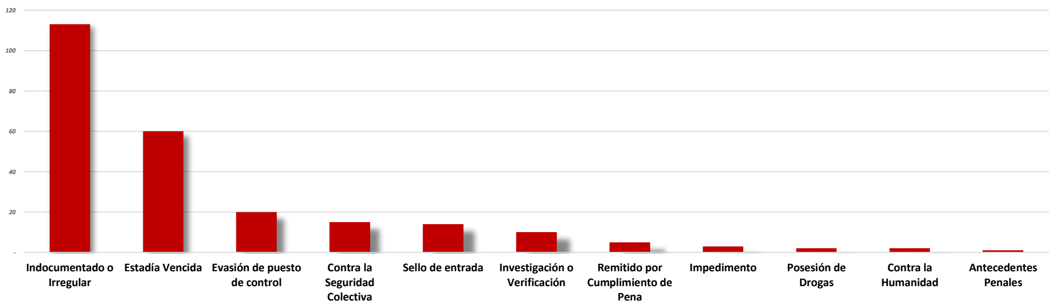
Gráfico No. 3 EXTRANJEROS CON ESTATUS IRREGULAR Y FALTAS A LA LEGISLACIÓN ADMINISTRATIVA Y PENAL REMITIDOS POR RAZÓN: AÑO 2020

Cifras preliminares actualizadas al 31 de marzo de 2020.